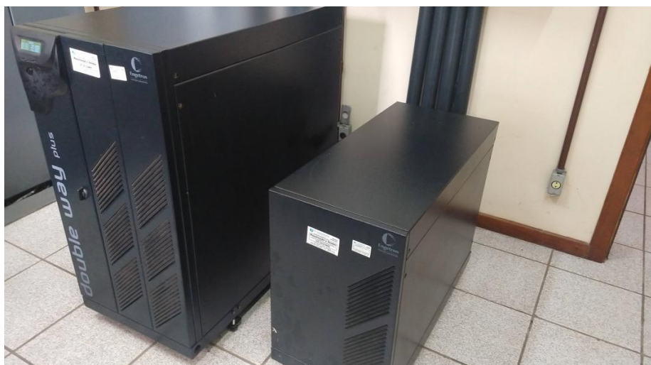
Figura 02 - Nobreak e transformador de isolação