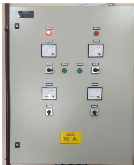
Figura 03 – quadro elétrico