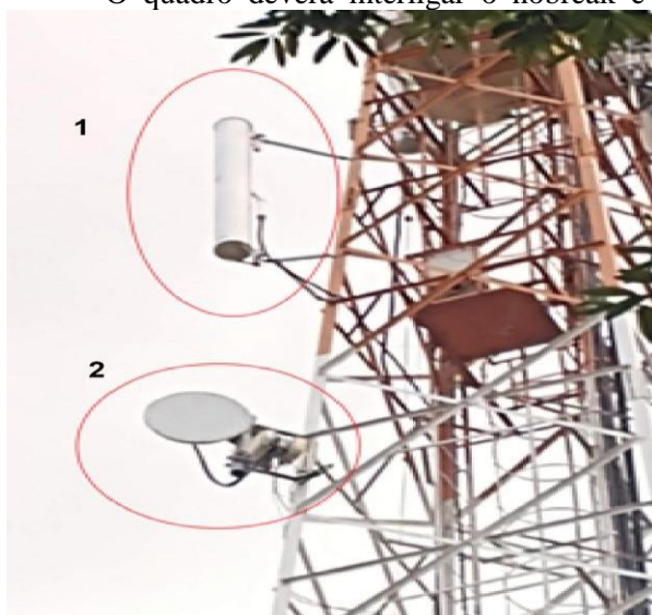
Figura 04 - Antenas da JFTV Câmara instaladas na torre