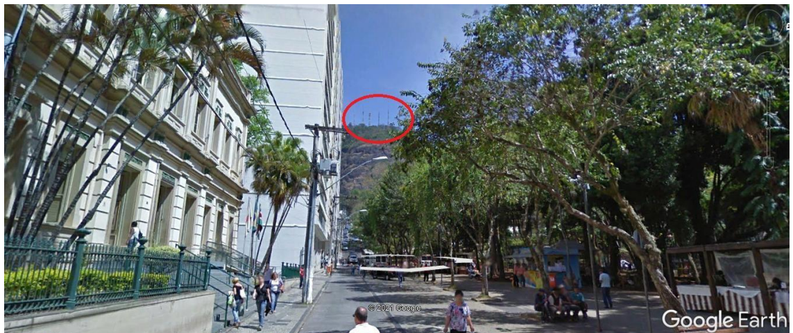
Figura 7 – Torres avistadas da entrada do prédio da Câmara Municipal, onde está instalado o link de transmissão

□ O novo prédio deverá contemplar uma sala com no mínimo 10 metros quadrados para acondicionar os equipamentos da JFTV Câmara.