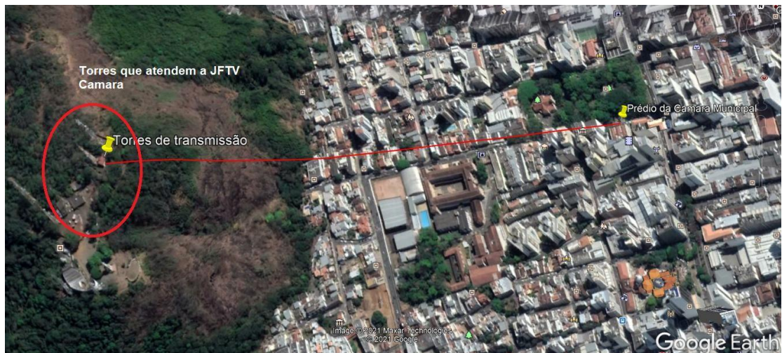
Figura 6 - Torres que atendem a JFTV Câmara

□ O novo local de instalação deverá ter visada direta com o prédio da Câmara Municipal de Juiz de Fora, localizado na Rua Halfeld, 955 centro da cidade de Juiz de Fora, com o objetivo de montar o link entre estúdio da JFTV Câmara e o transmissor; Conforme figuras 6 e 7.