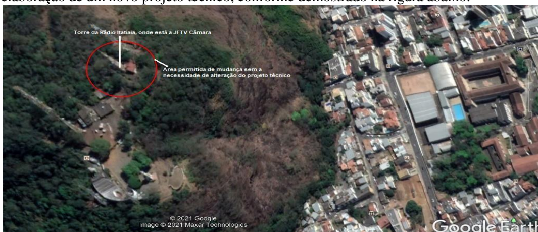
Figura 5 – Considerando um raio máximo de 30 metros de diâmetro

□ Mediante as coordenadas acima, a empresa pretendente deverá possuir as suas instalações dentro de um raio de no máximo 30 metros, em relação ao local atual instalado, não ultrapassando os 5% dos radiais, conforme aprovado em projeto. Isentando assim, a JFTV Câmara da necessidade de elaboração de um novo projeto técnico, conforme demonstrado na figura abaixo: