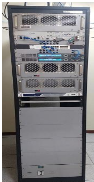
Figura 1: Rack com os equipamentos da JFTV Câmara