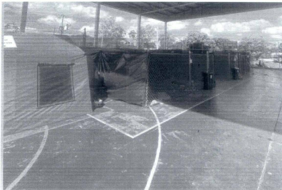
ABRIGO PRAÇA CEU