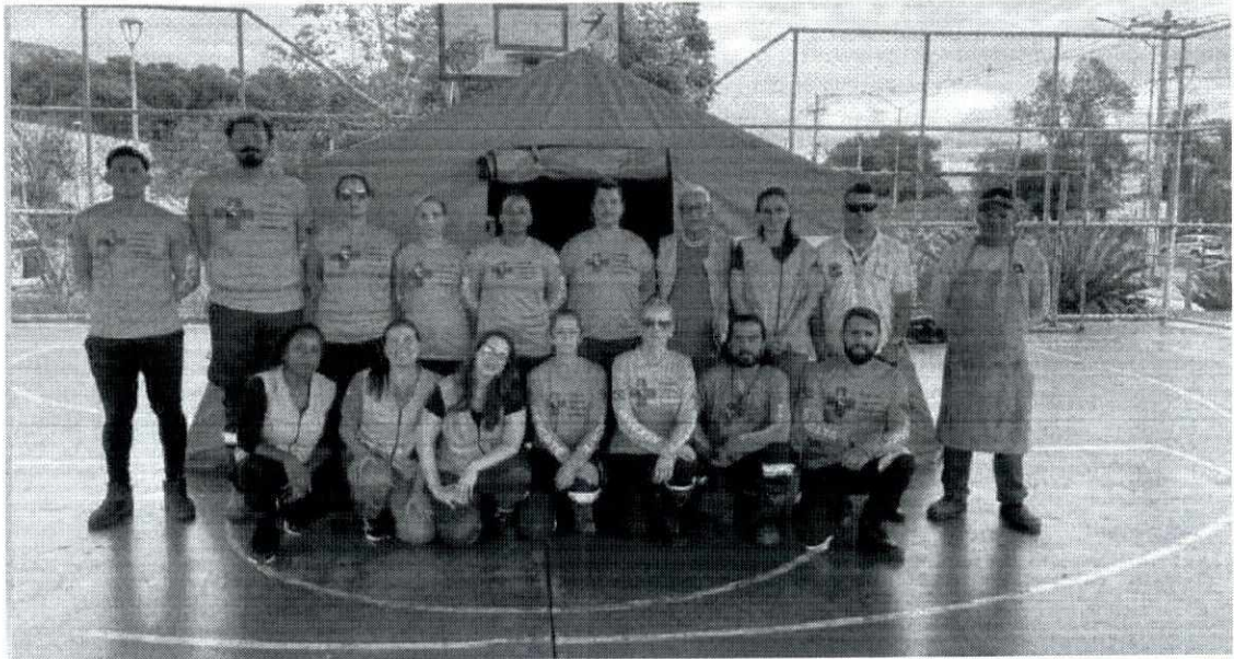
Grupo GRAD de Conselheiro Lafaiete e Secretaria do Bem-Estar Animal