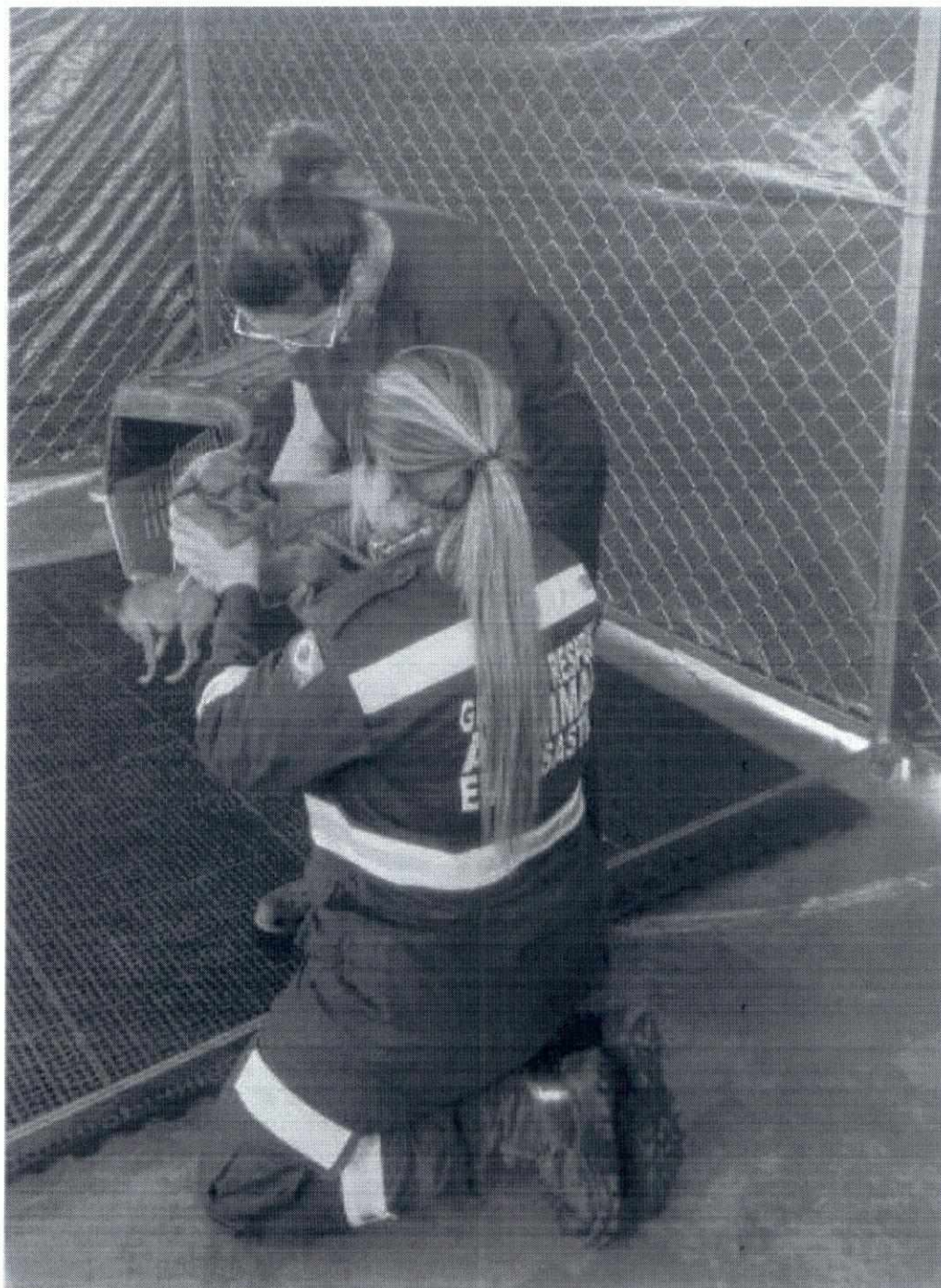
Chegada de animais no abrigo