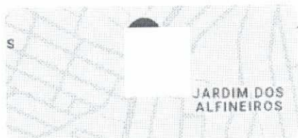
Captura da imagem: mai. de 2022

Juiz de Fora, Minas Gerais Google Street View mai. de 2022 Ver mais datas