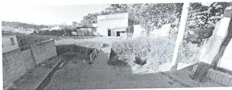
Ponte o final da Rua Jair Pereira.

Foi necessária realização de visita técnica ao local para constatar a situação atual da localidade, dado que não foram encaminhados registros fotográficos atualizados. As imagens previamente disponíveis pela ferramenta “Google Streetview” indicavam a existência da ponte no local, conforme imagem abaixo: