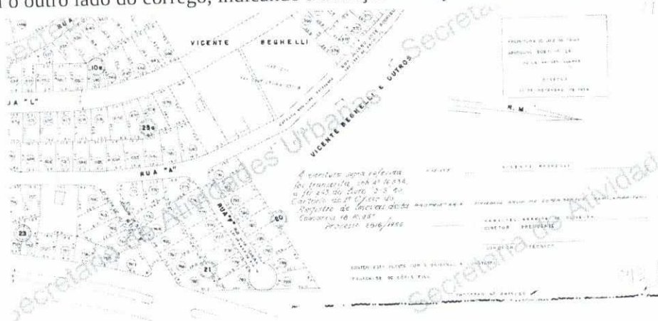
Planta do loteamento aprovado figurando a Rua Jair Pereira.

A planta do loteamento Santos Dumont abaixo indica a Rua Jair Pereira como viradouro, sem conexão com o outro lado do córrego, indicando a situação de improviso da conexão.