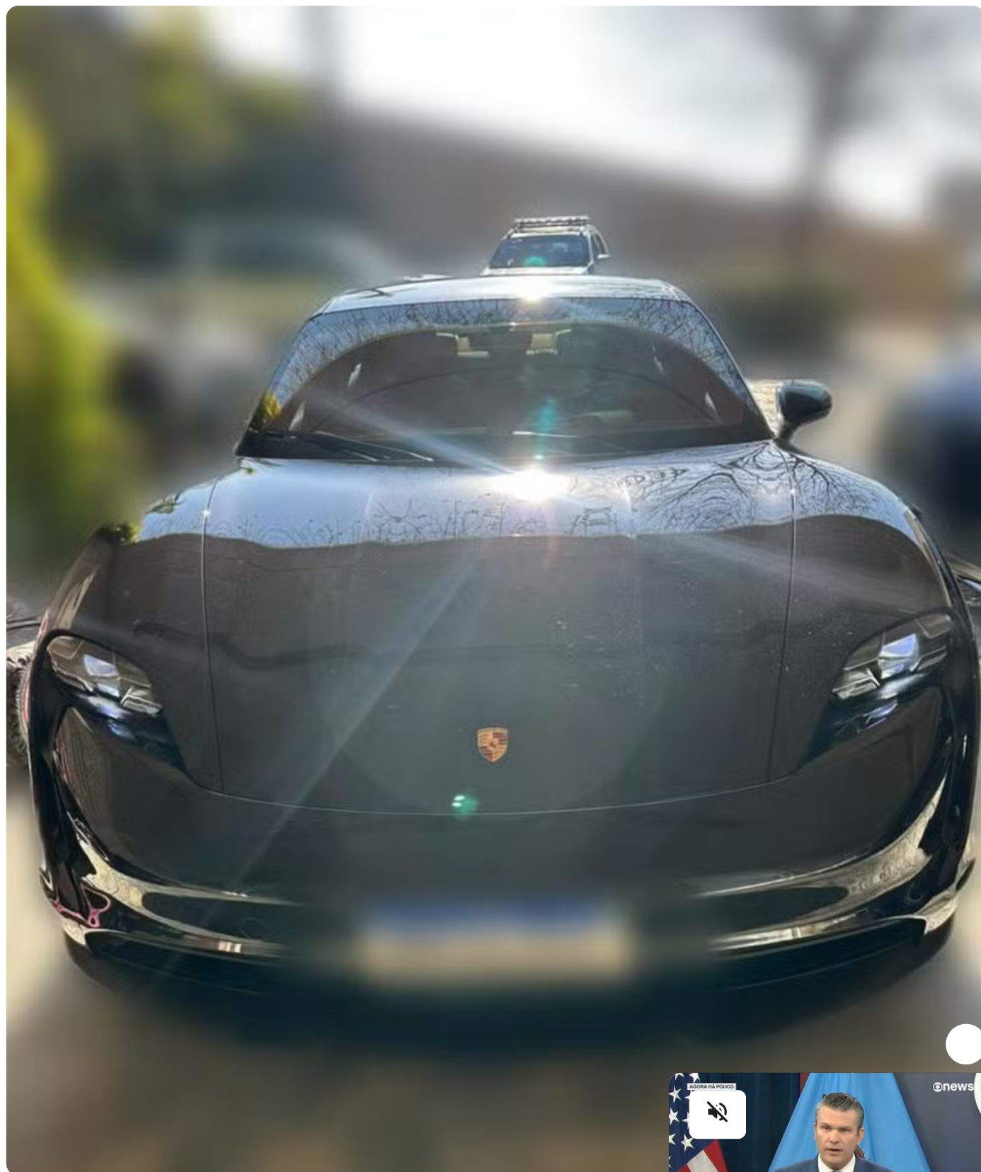
Carros de luxo e obras de arte são apreendidos na Grande BH em operação contra fraudes no DNIT