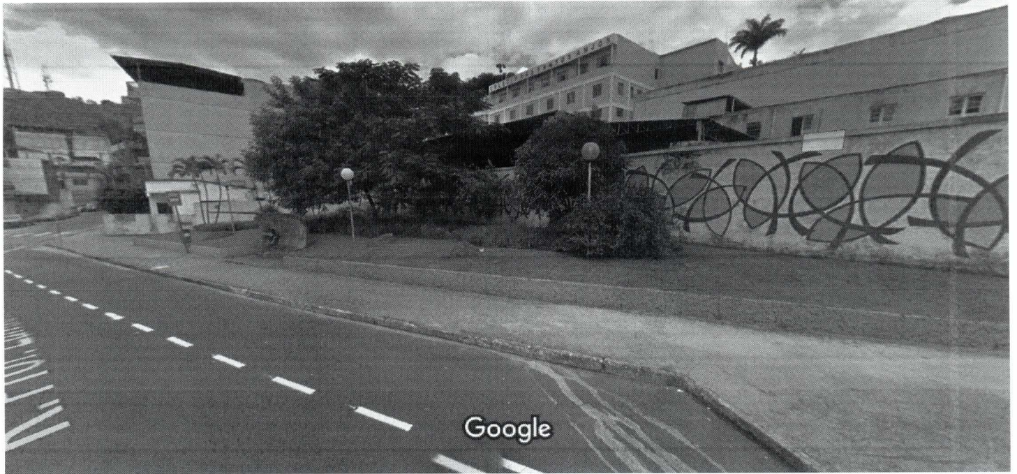
Captura da imagem: abr. 2015