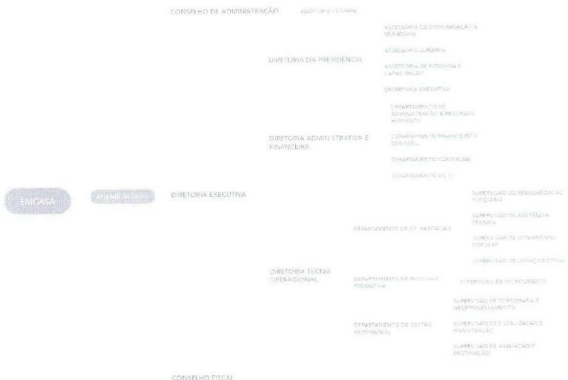
Figura 3 - Proposta de Nova Estrutura Organizacional