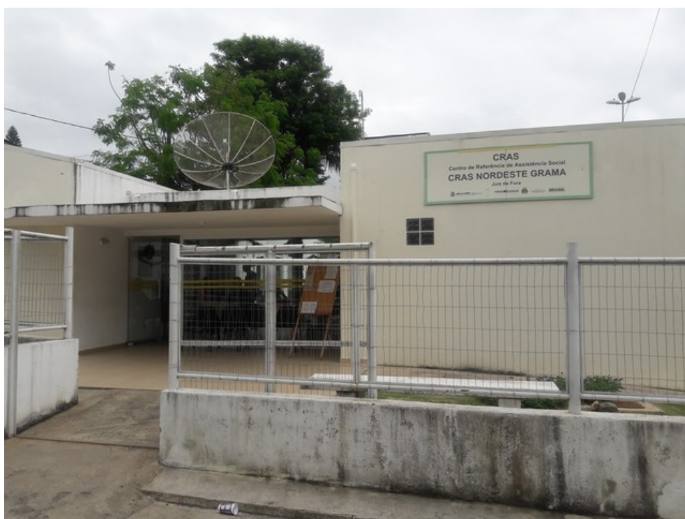
Fachada do CRAS

Melhoria das condições de sigilo nas baias de atendimento através de uma maior isolamento entre as mesmas e os demais usuários da unidade.