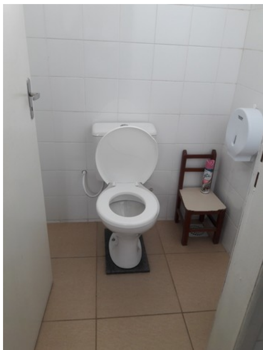
Banheiro dos funcionários