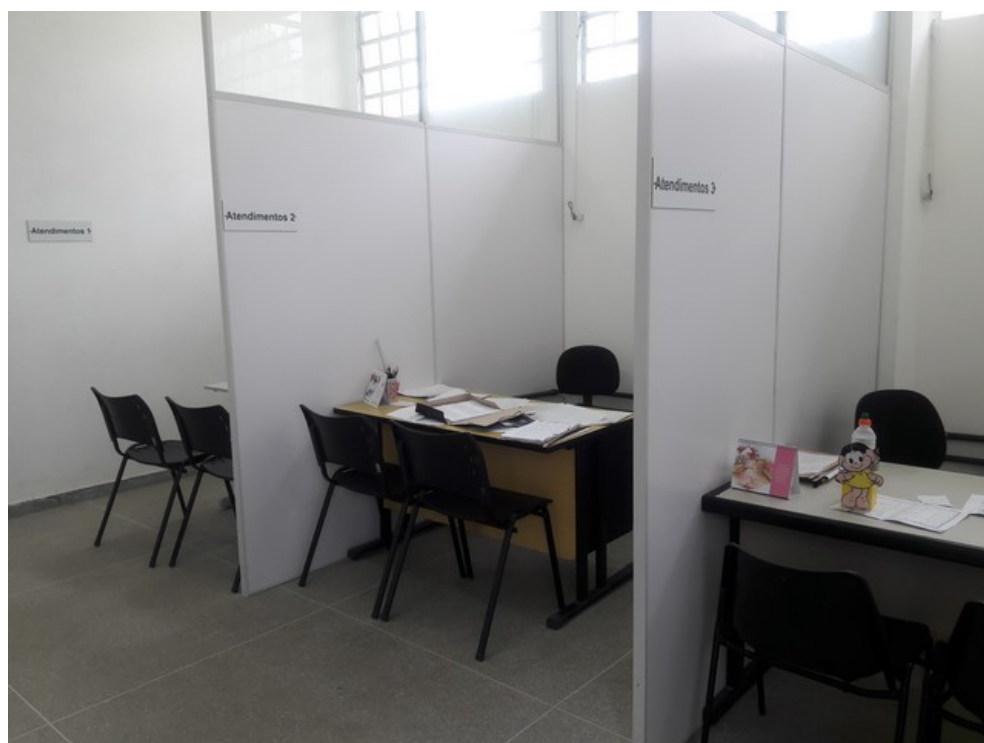
Baia de atendimento