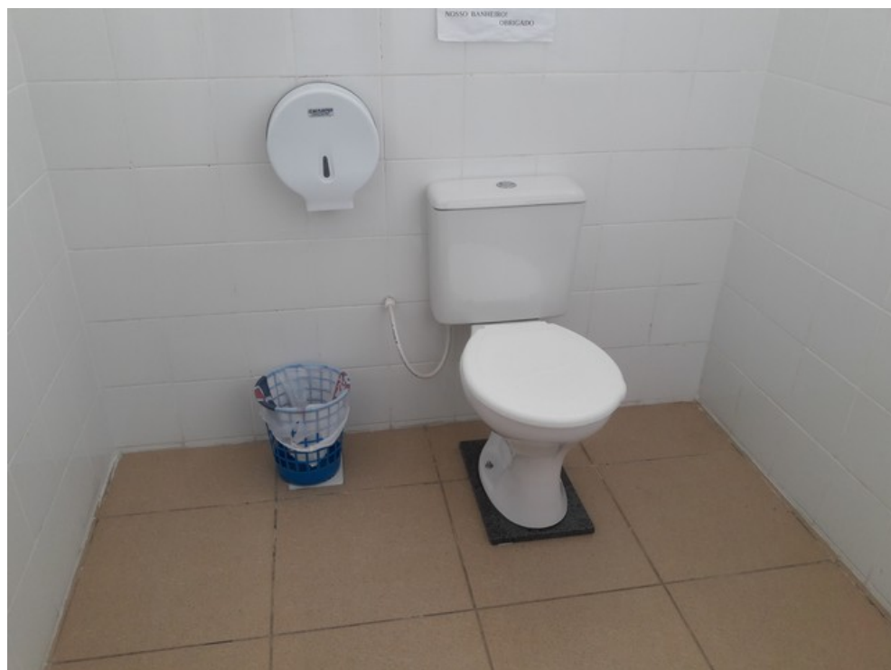
Banheiro dos usuários