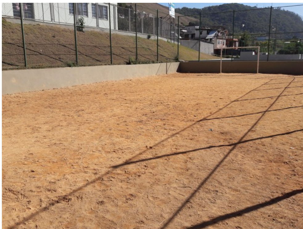
Quadra de areia