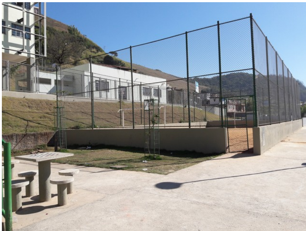
Vista geral da praça