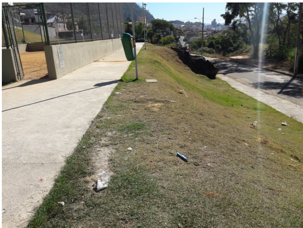
Gramado ao lado da quadra