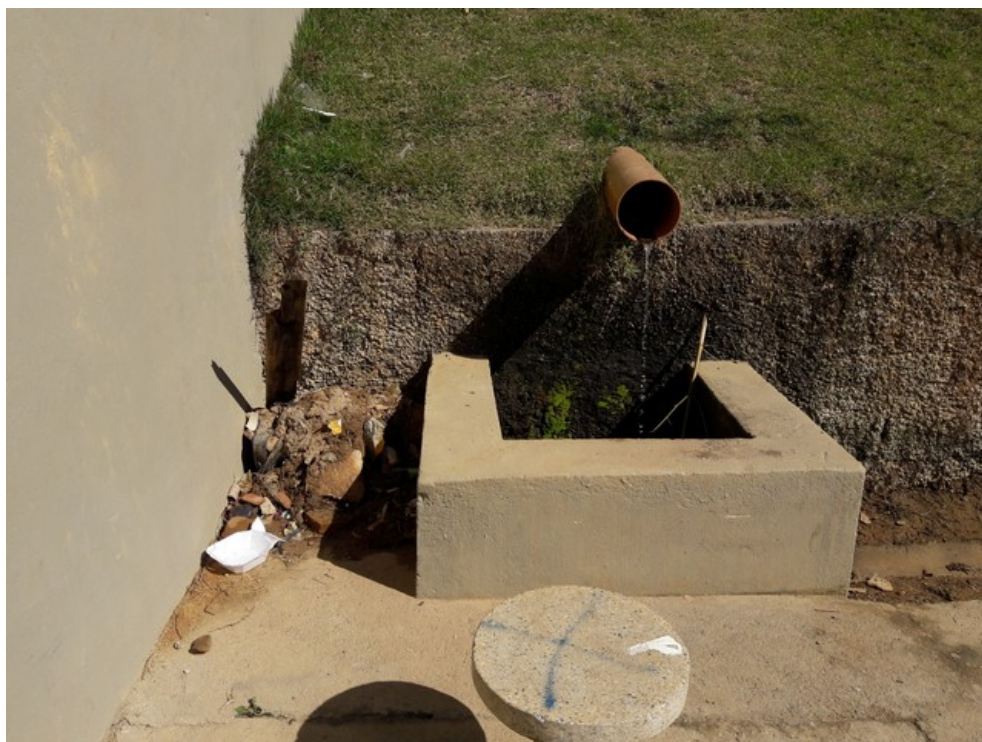
Mina de água