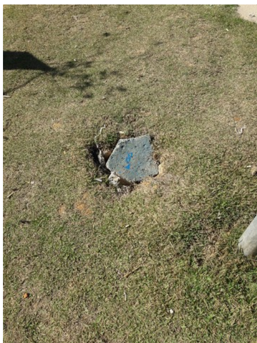
Caixa de passagem de energia