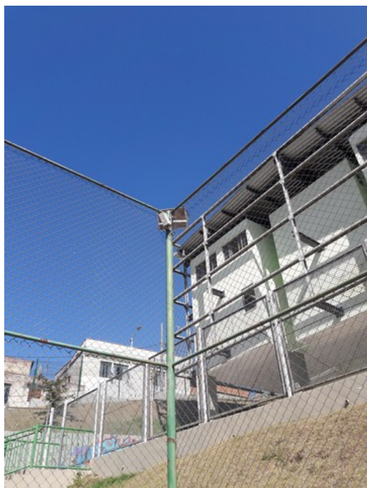
Holofote de iluminação da quadra