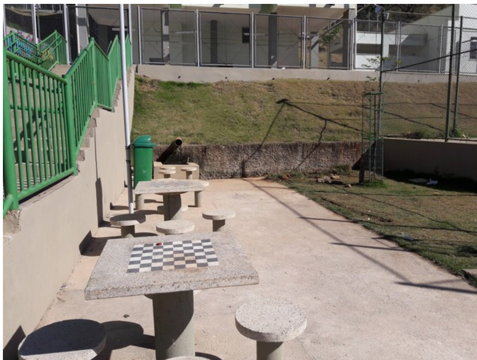
Mesas e bancos