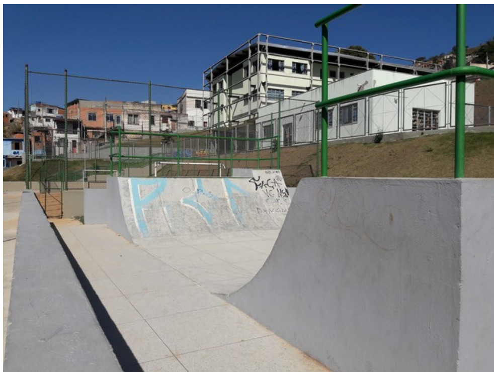
Pista de skate