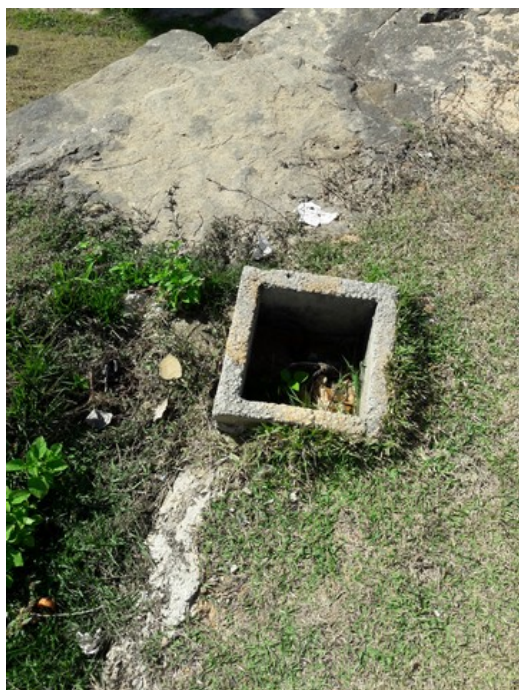
Caixa de passagem de energia