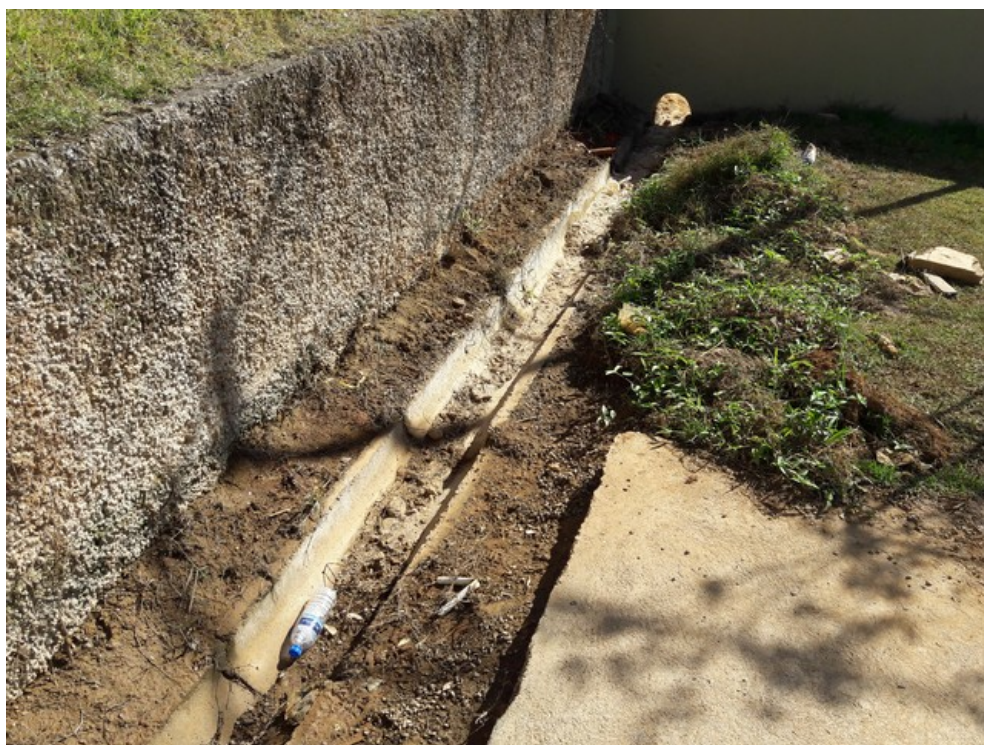
Canaleta de escoamento