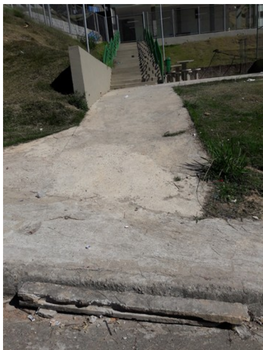
Rampa de acesso à praça