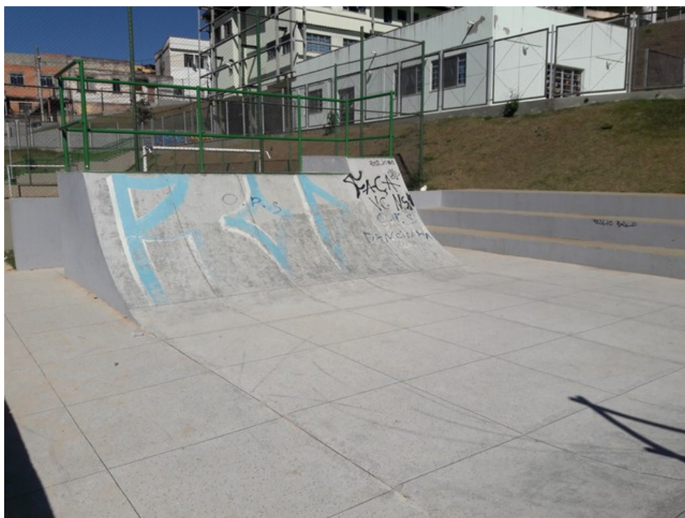
Pista de skate