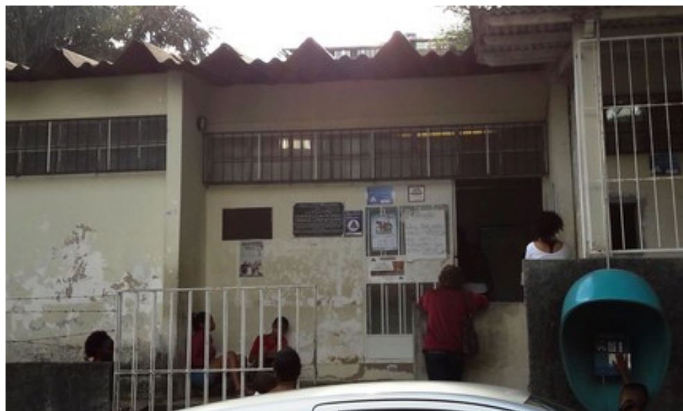
Fachada da UAPS