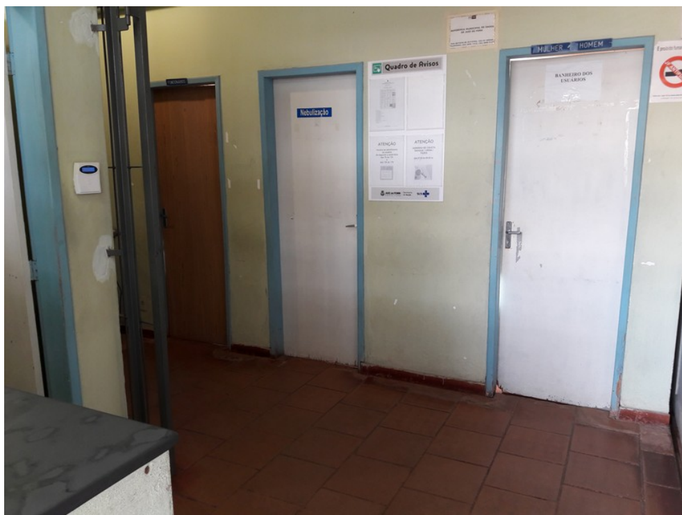
Área de acesso aos consultórios