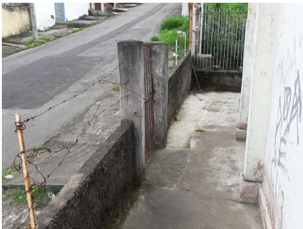
Área lateral da unidade com acesso através de rampa