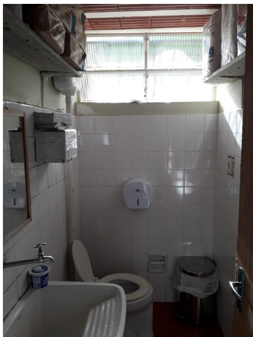
Área utilizada como lavanderia, depósito de material de limpeza e banheiro dos funcionários