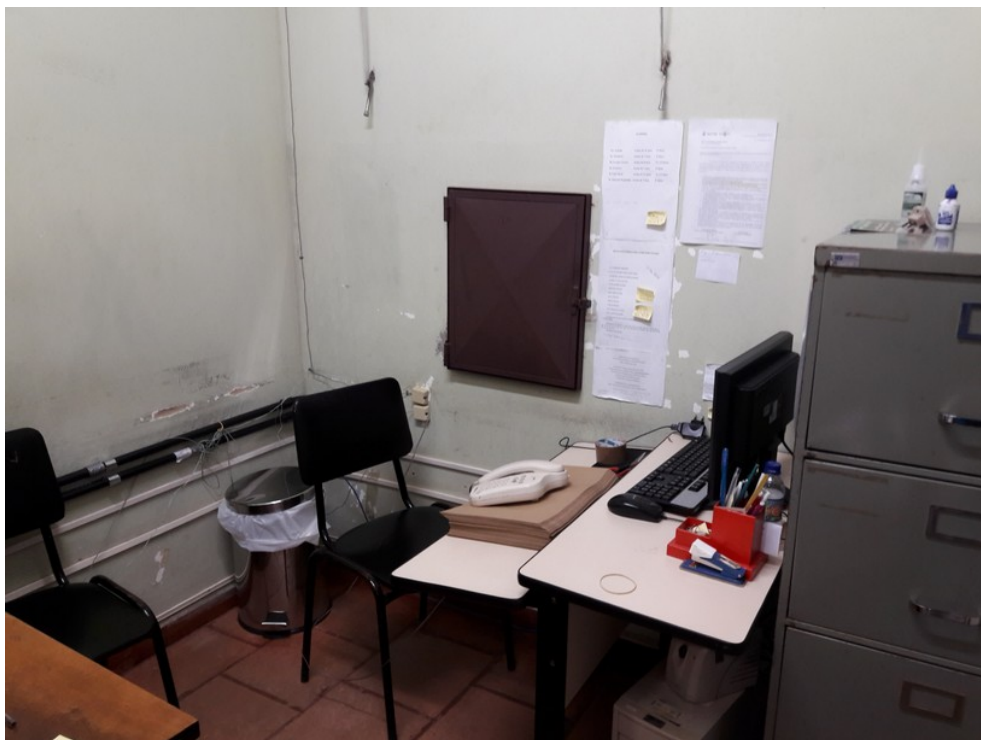
Central de Marcação de Consultas (CMC)