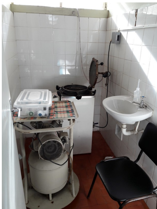
Sala de nebulização e autoclave.