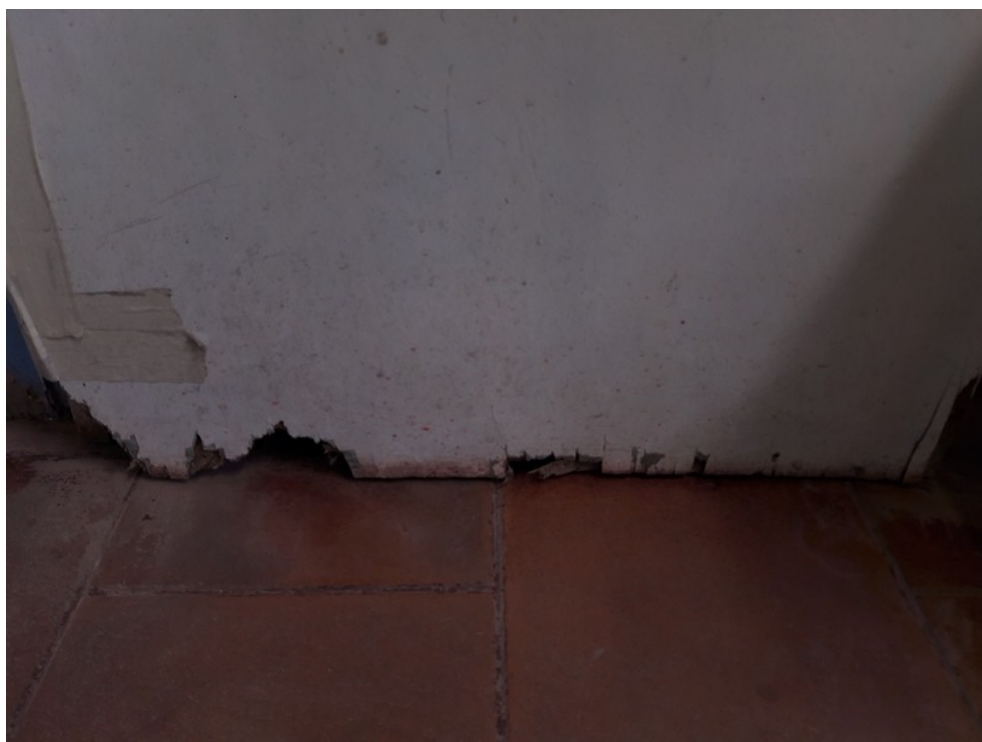
Sala de procedimentos de enfermagem