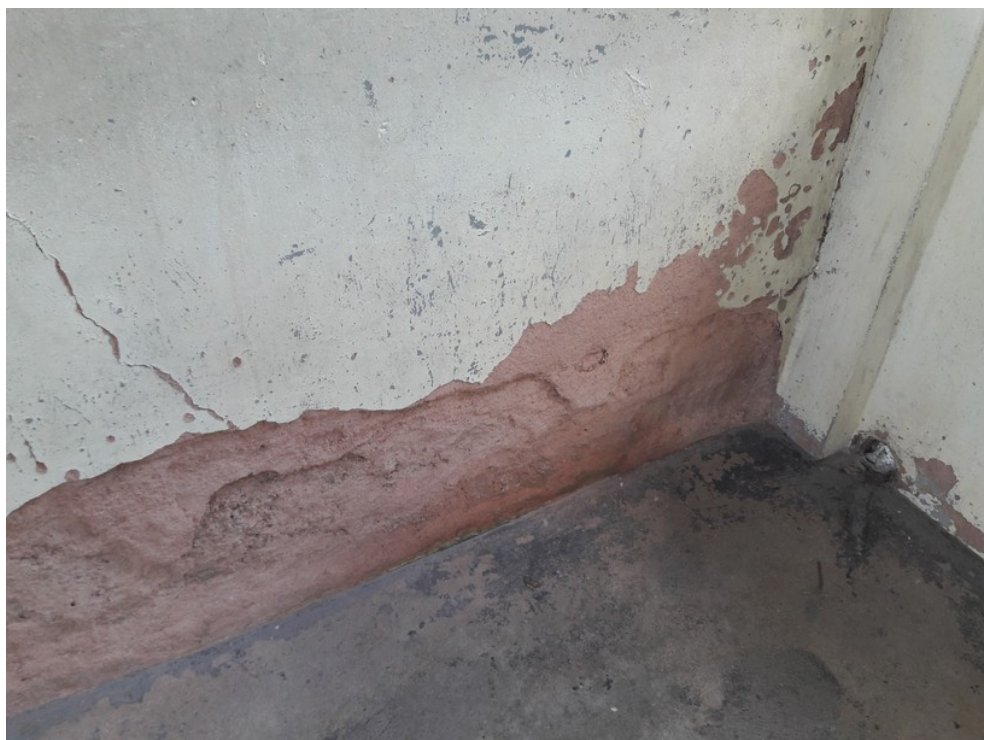
Parede externa da unidade