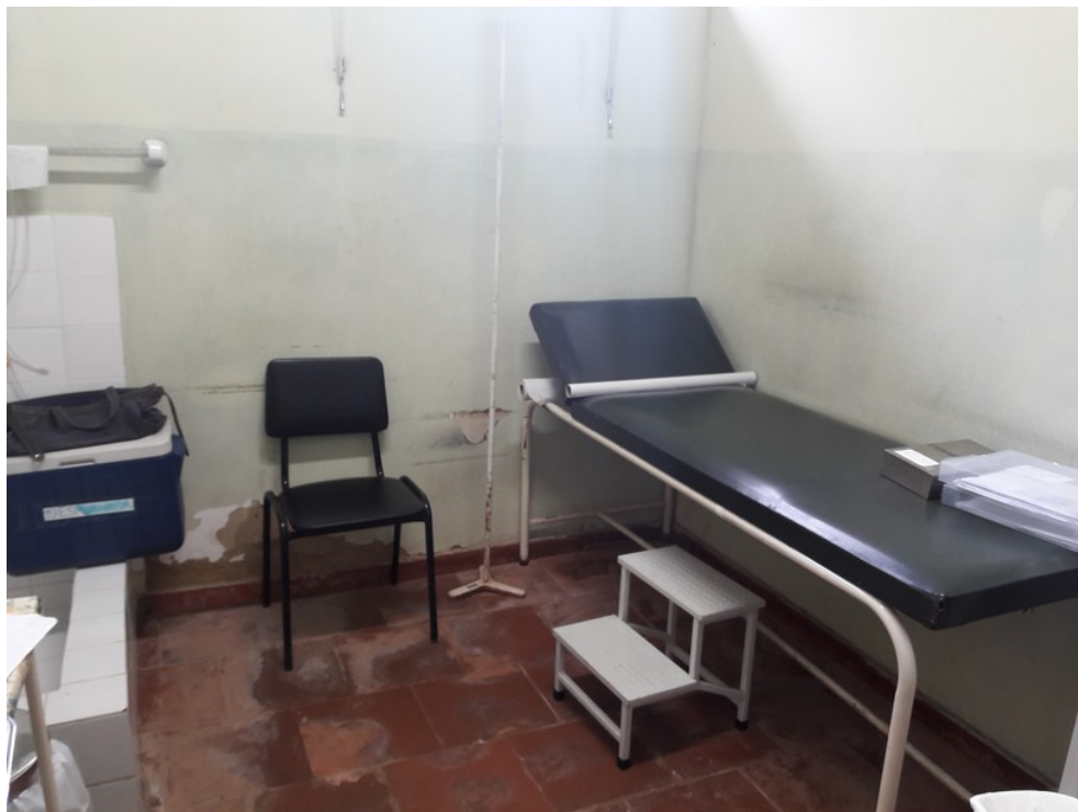
Sala de procedimentos de enfermagem