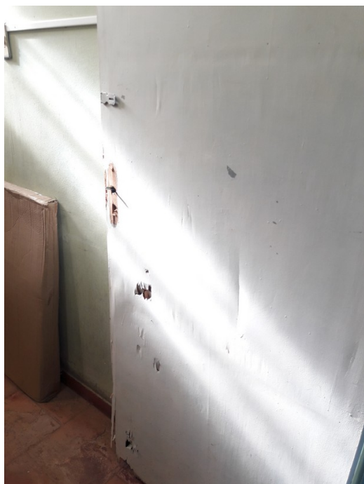
Porta do Almojarifado