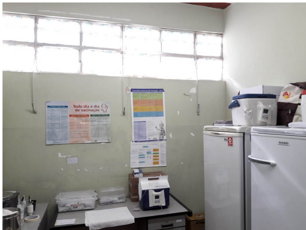
Sala de vacinas