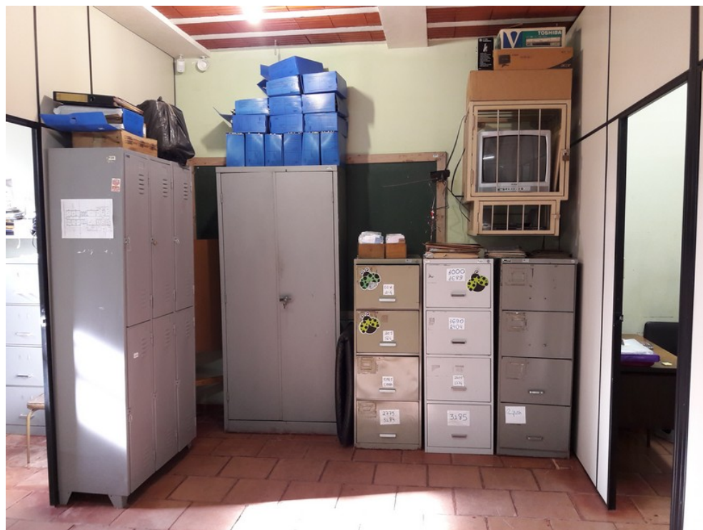
Área com múltiplas funções (corredor de acesso, arquivo, armário de funcionários, etc)