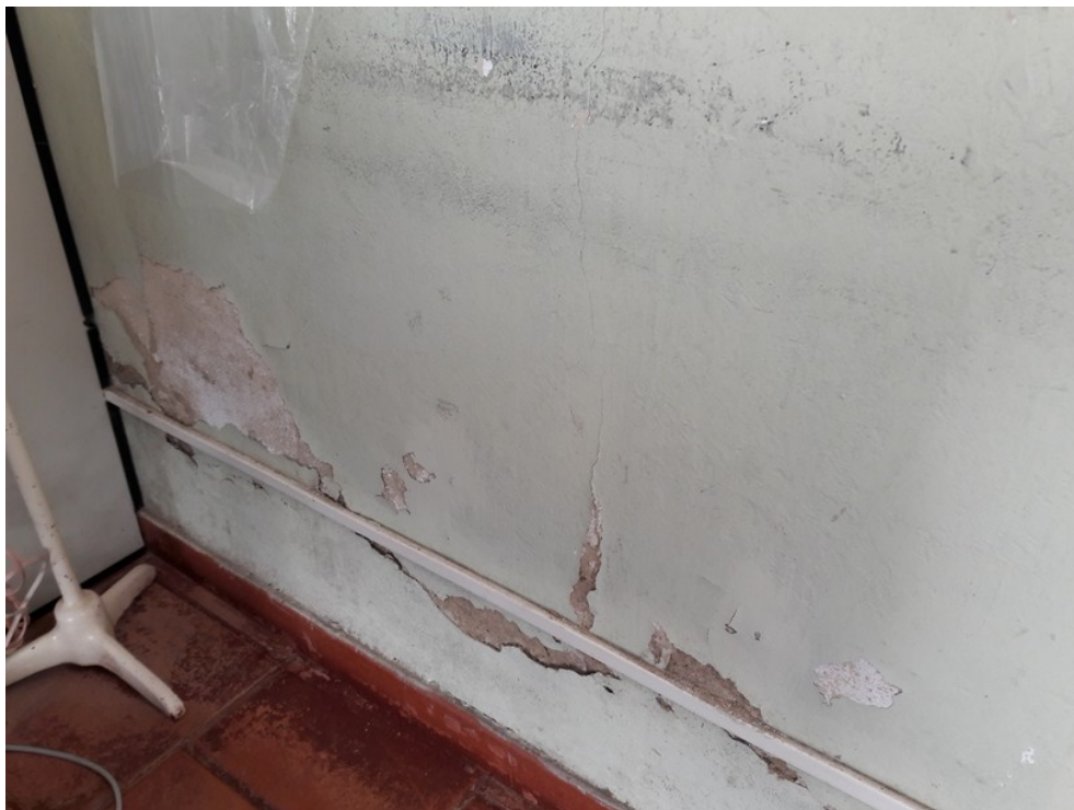
Sala de supervisão de enfermagem