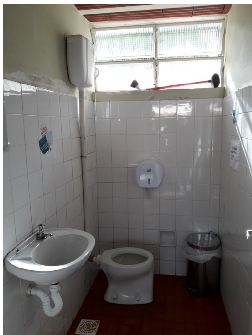
Único banheiro, unissex, dos usuários