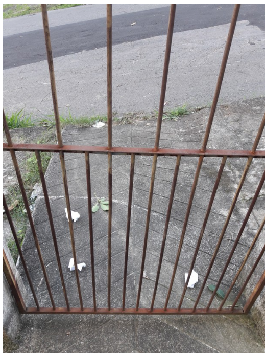
Rampa de acesso