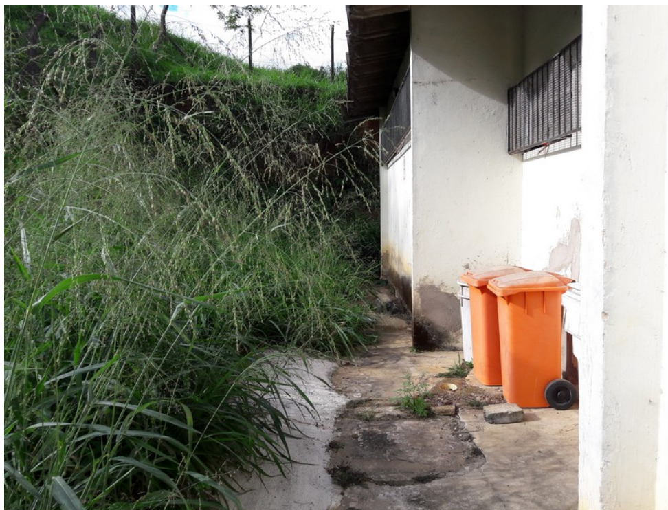
Área traseira da unidade (depósito de lixo)