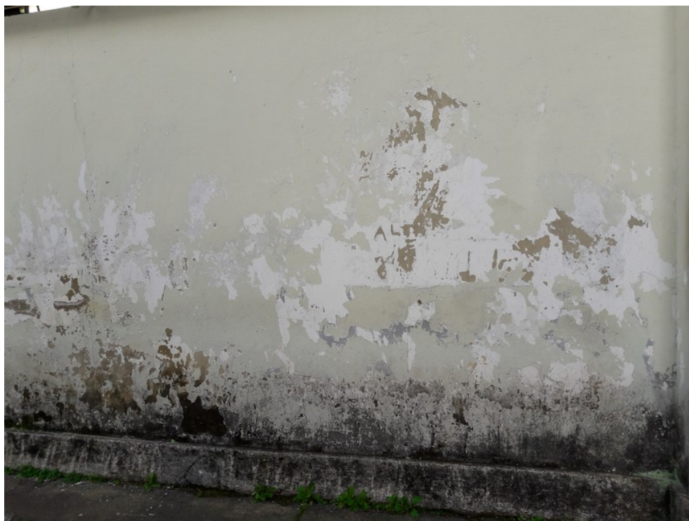
Parede externa da unidade