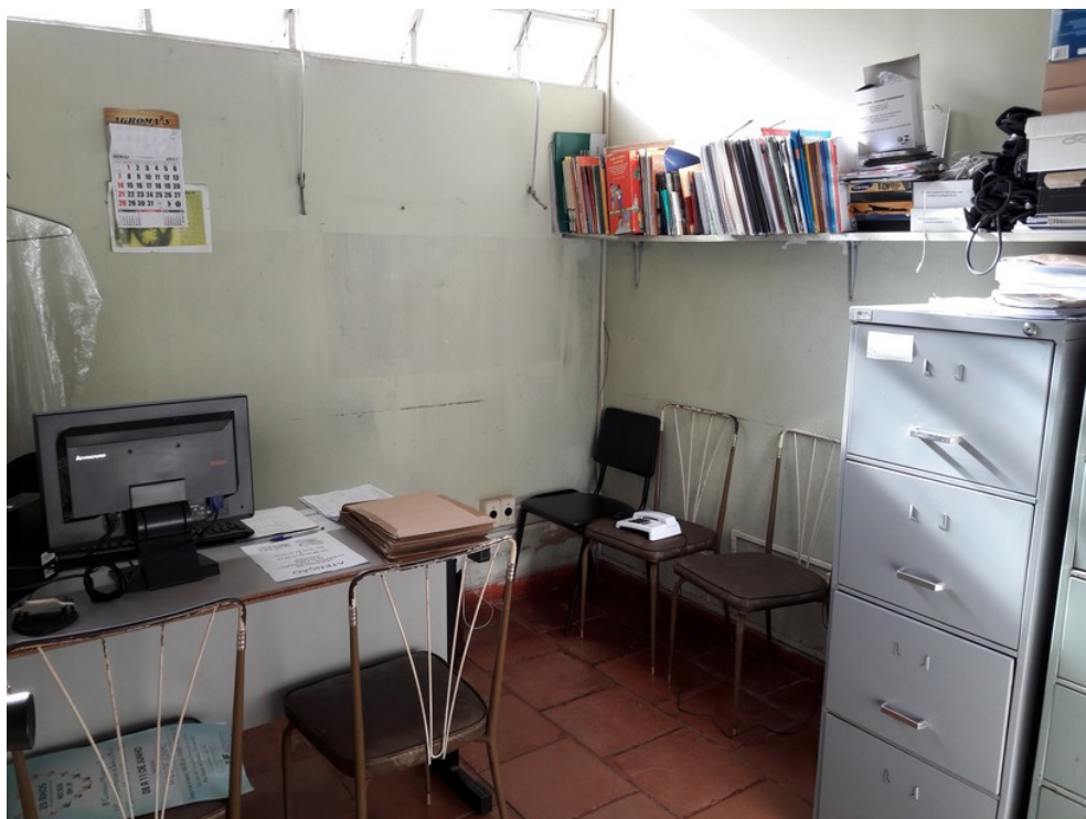
Sala de supervisão de enfermagem