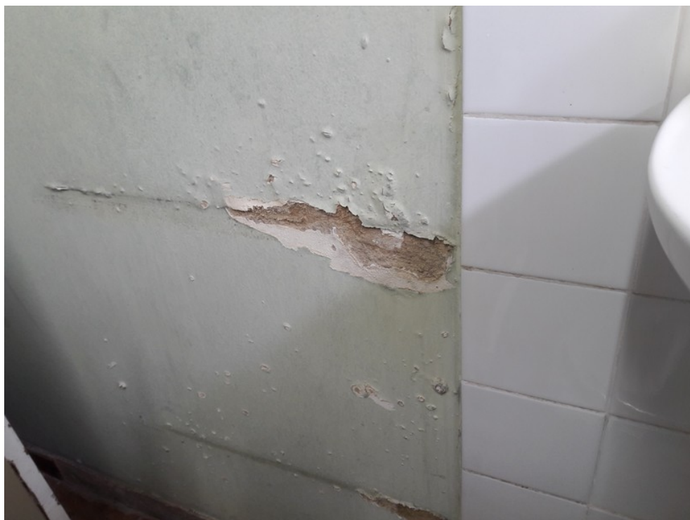
Sala de procedimentos de enfermagem