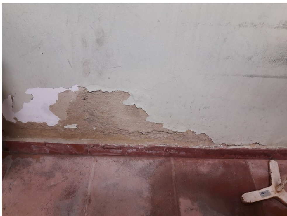
Sala de procedimentos de enfermagem