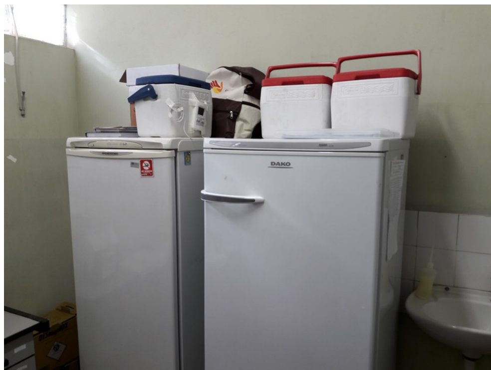
Sala de vacinas