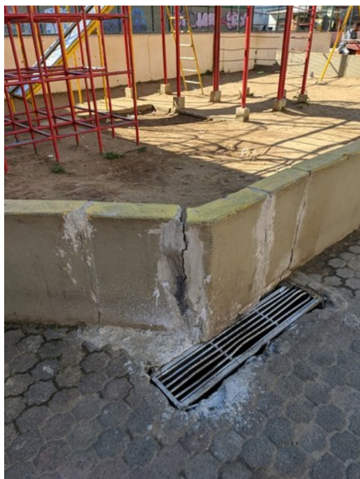
Rachadura na mureta do parquinho infantil