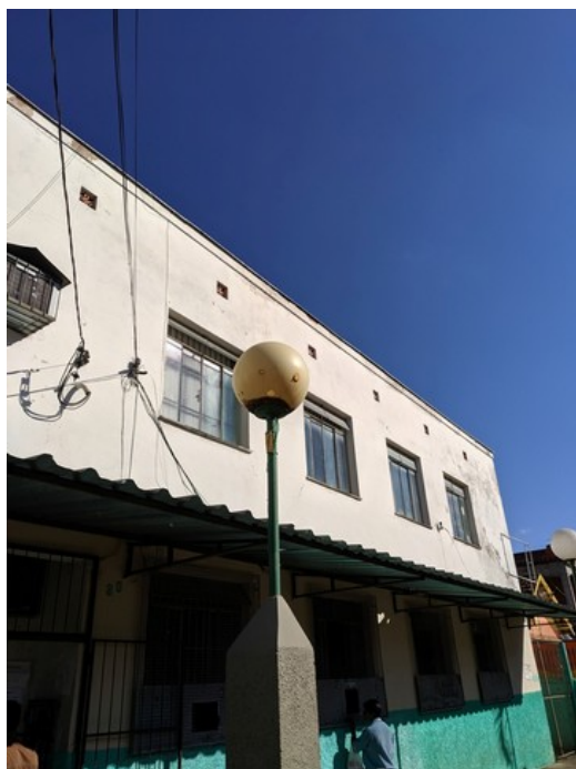
Ponto de iluminação da praça aparentemente não funcional