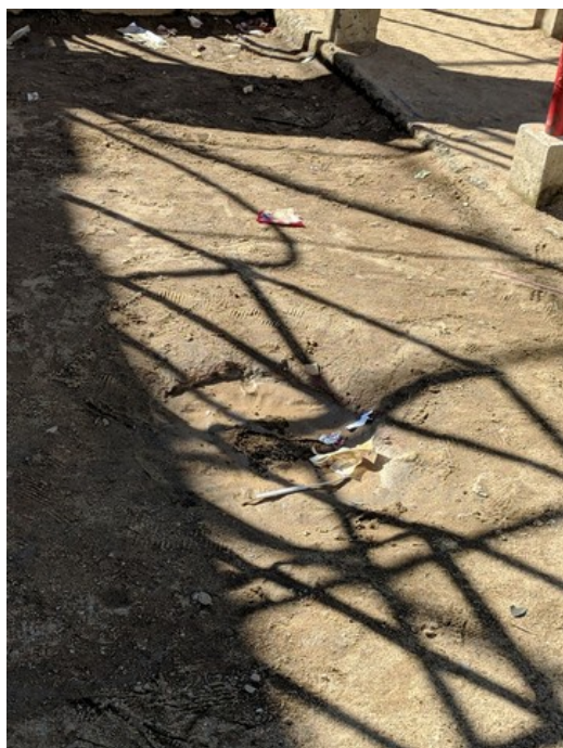
Formação de poça d'água no parquinho infantil