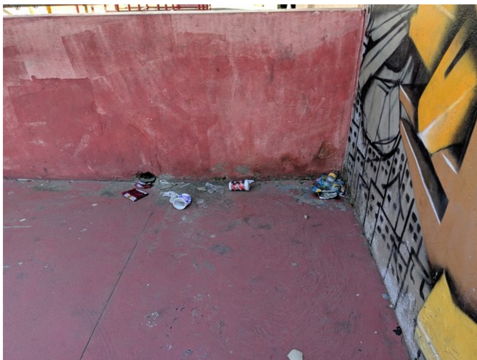
Lixo acumulado no interior da quadra