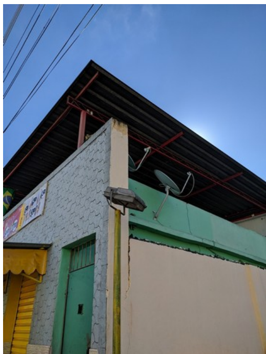
Ponto de iluminação da praça aparentemente não funcional