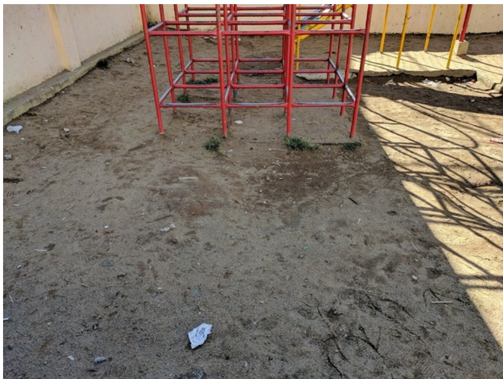
Parquinho infantil sujo