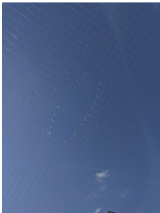
Rede de cobertura da quadra furada