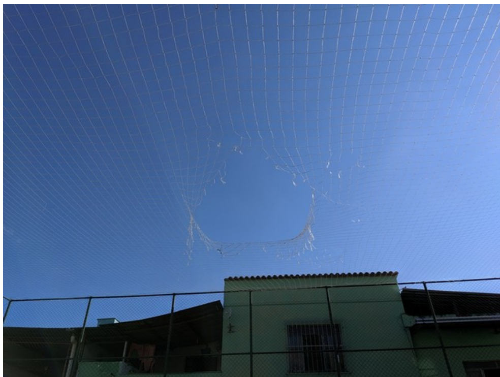
Rede de cobertura da quadra furada