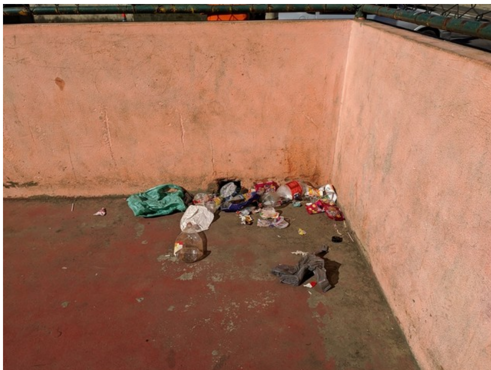
Lixo acumulado no interior da quadra