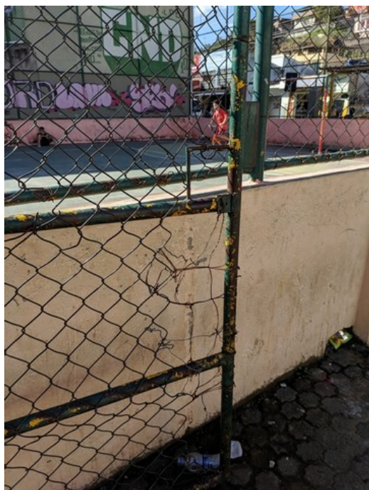
Grade do portão de entrada da quadra danificada