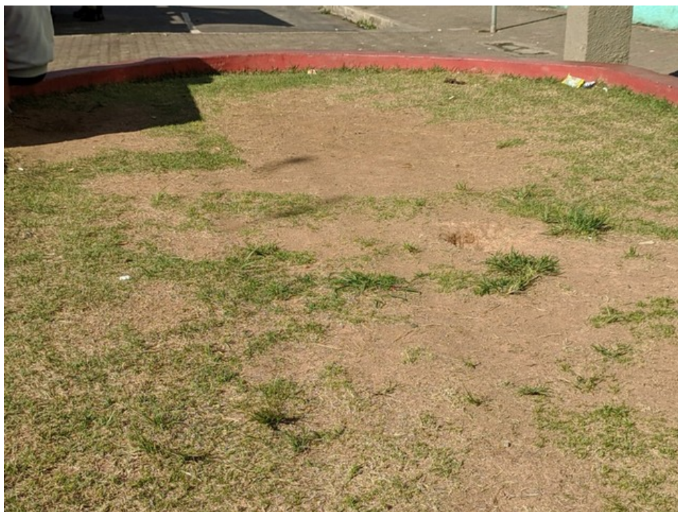
Gramado do jardim desgastado