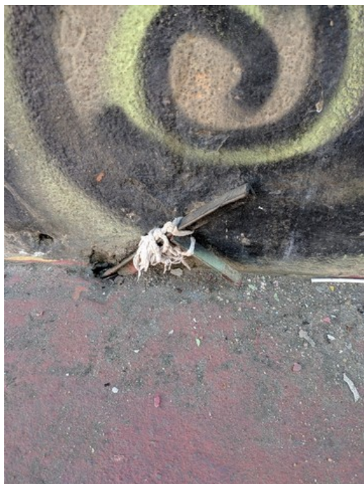
Ferro solto no interior da quadra