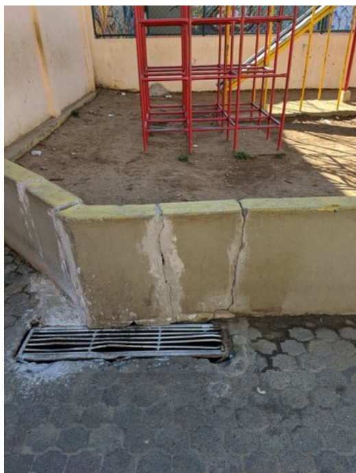
Rachaduras na mureta do parquinho infantil