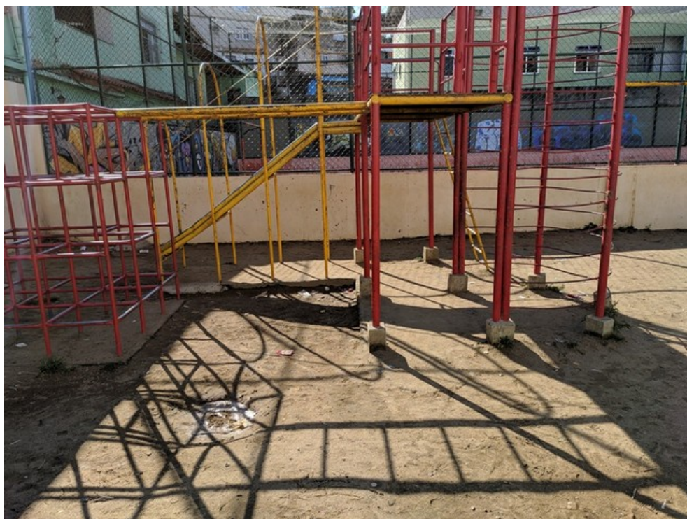
Formação de poça d'água no parquinho infantil