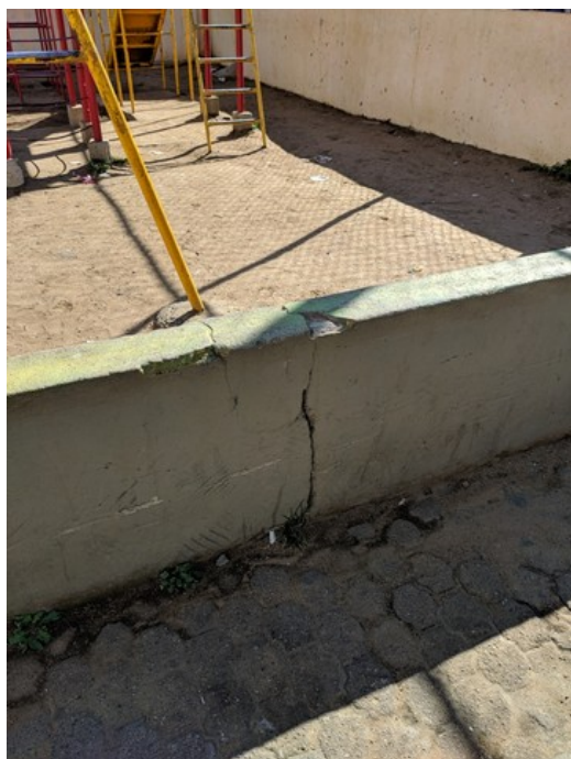
Rachadura na mureta do parquinho infantil