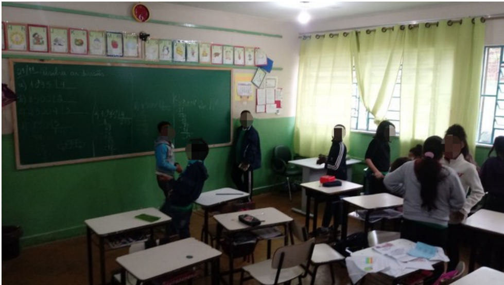
Sala de aule primeiro piso