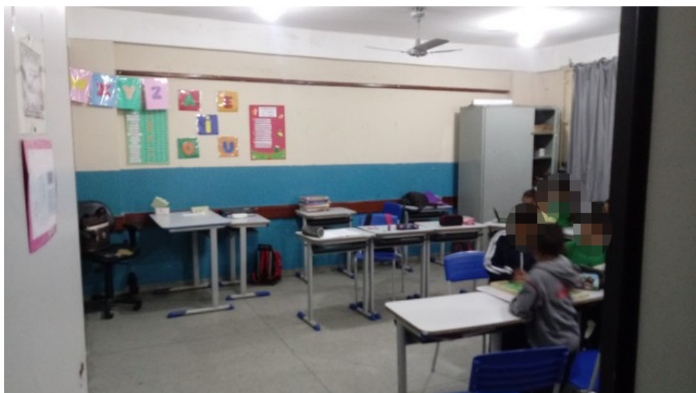
Laboratório de aprendizagem 2