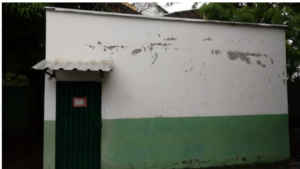
Sala de leitura. Construída em área sem acesso coberto.