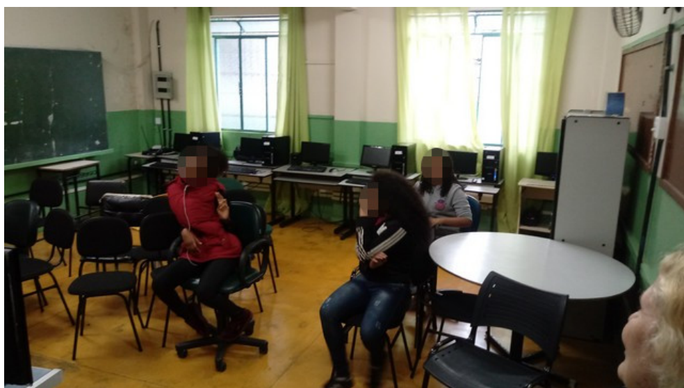
Laboratório de Informática