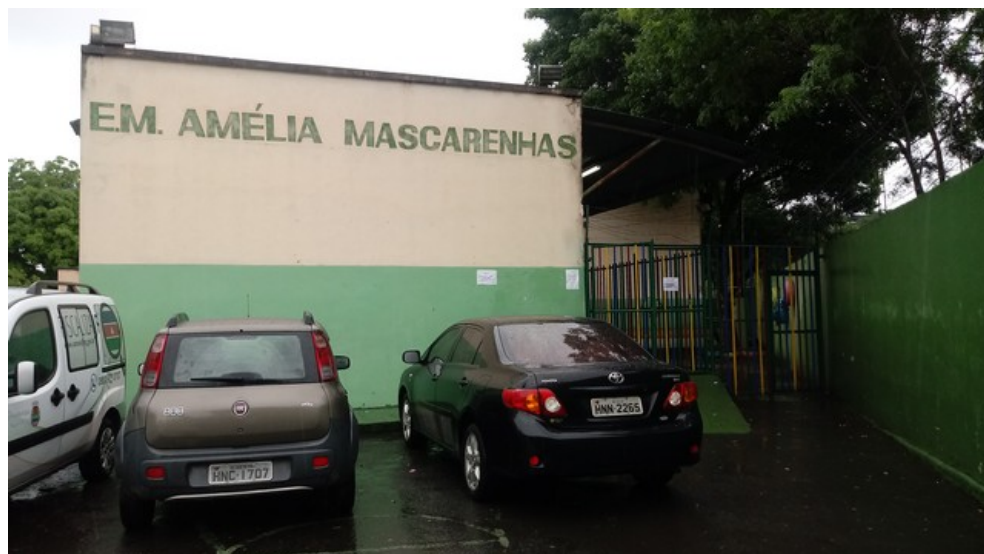
Fachada da escola