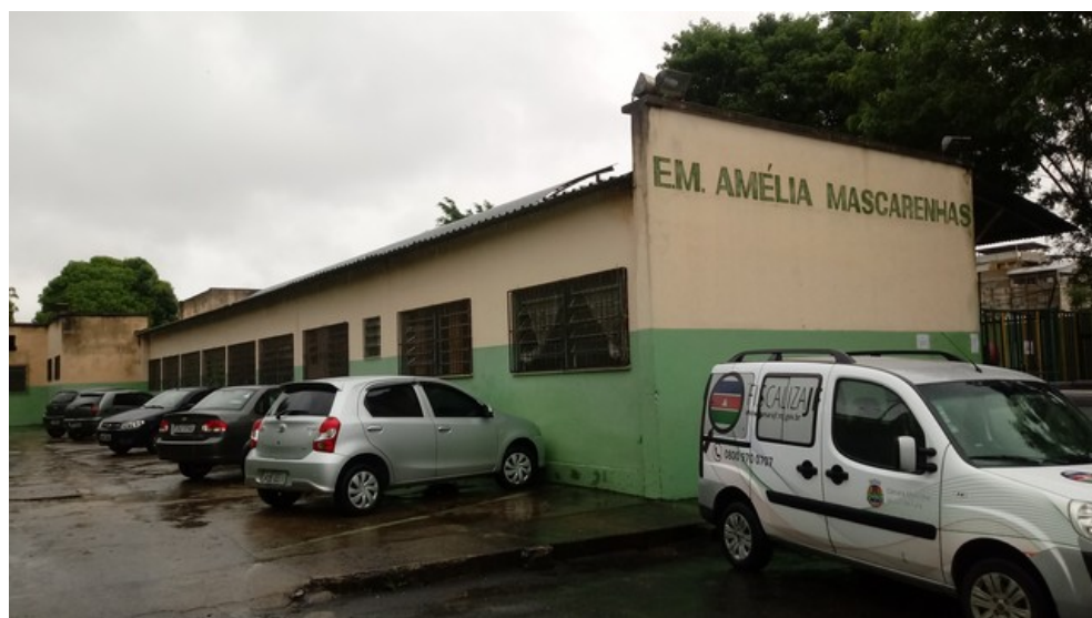
vista lateral - estacionamento