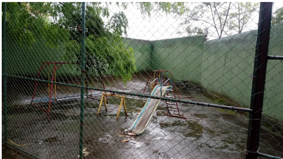
Parquinho - em área descoberta