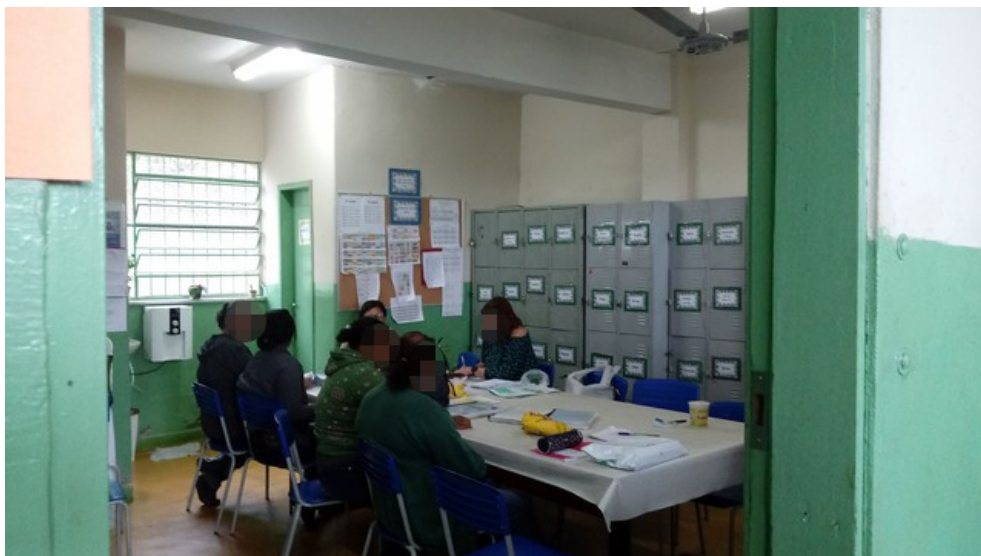
Sala dos professores