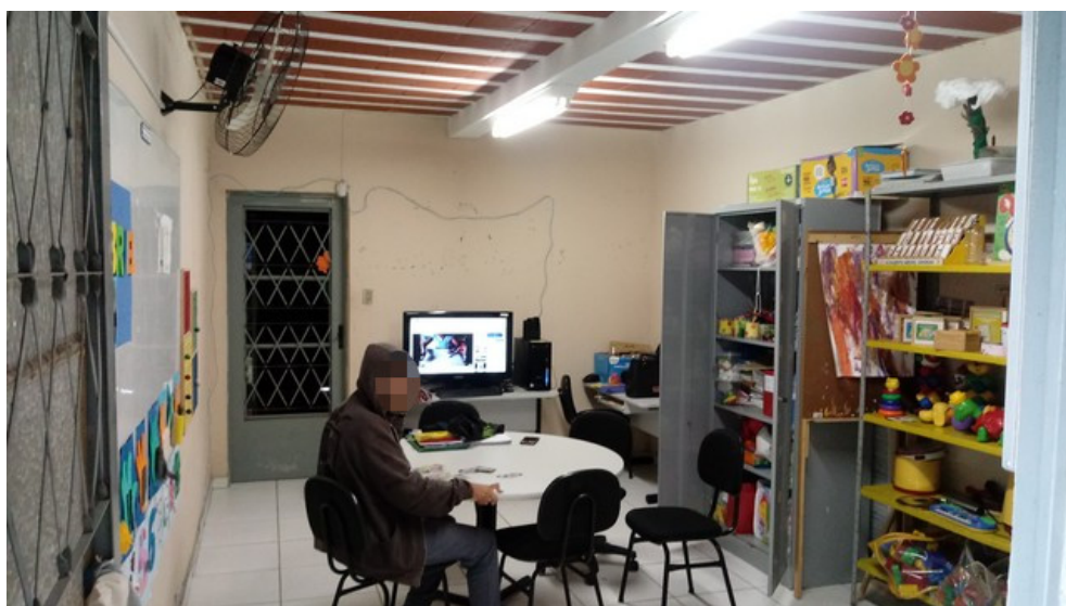
Sala de AEE