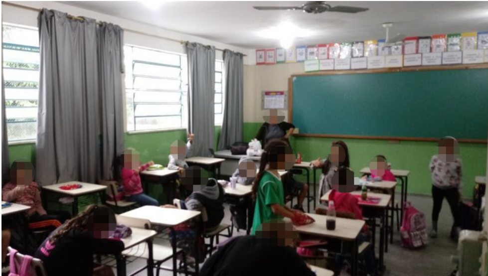
Sala de aule segundo piso