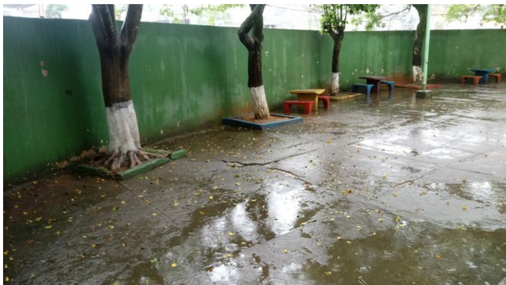
Pátio Educação física