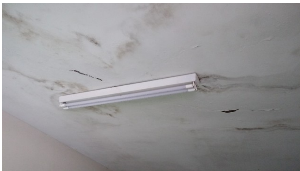
Infiltrações no acesso ao segundo pavimento