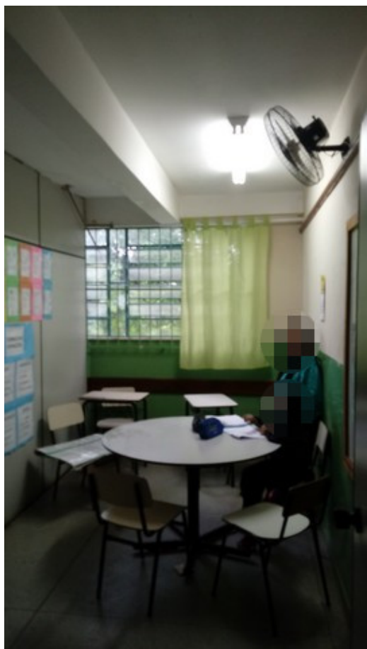
Laboratório de aprendizagem