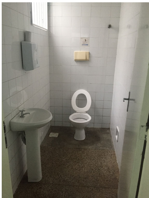
Banheiro para usuários