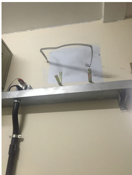
Área destinada ao sistema nobreak danificado no arrombamento