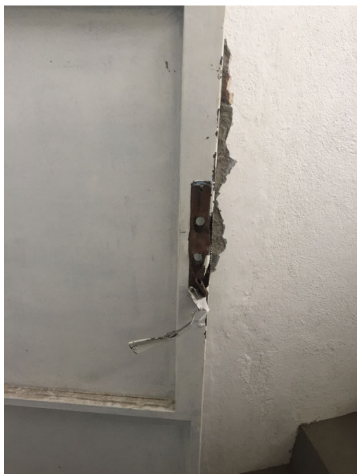
Porta de acesso ao segundo andar danificada no arrombamento