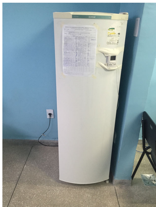
Sala de Vacinas