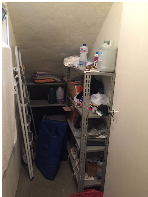
DML - depósito de material de limpeza