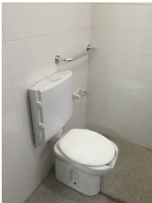
Banheiro adaptado de usuários