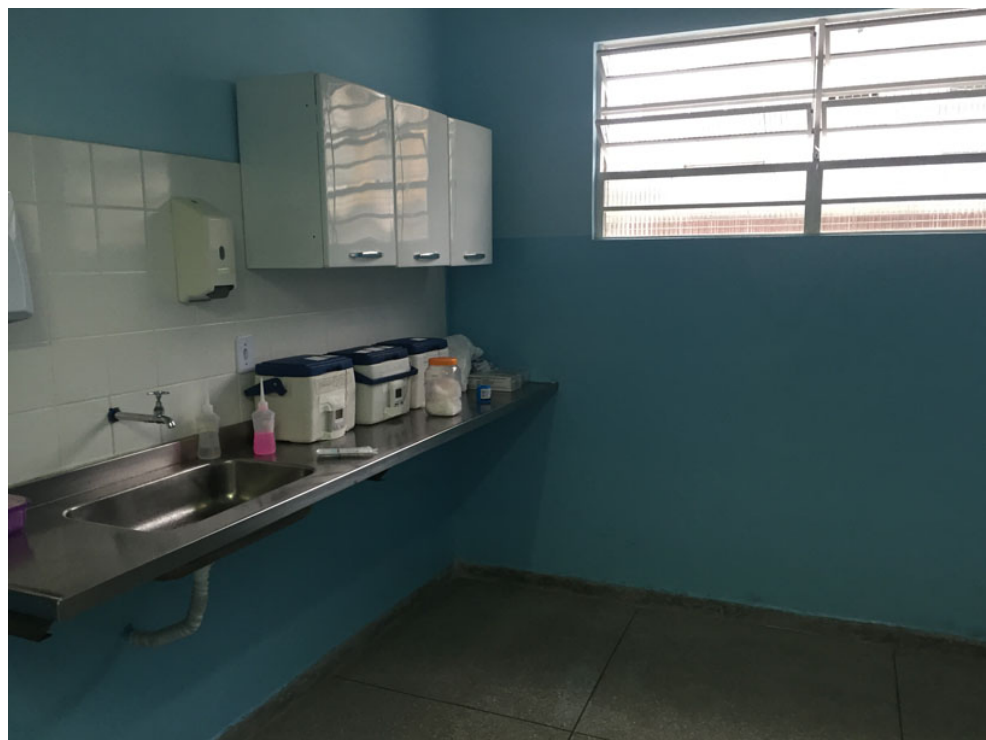
Sala de Vacinas