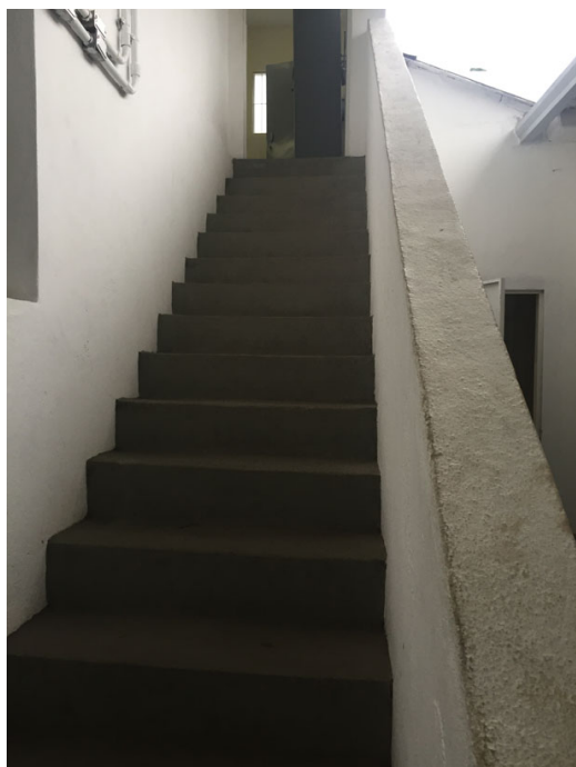
Escada de acesso ao segundo andar