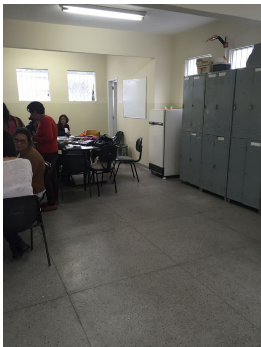
Sala de reuniões