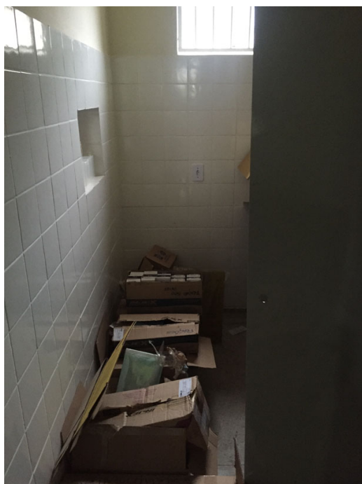
sala de expurgo