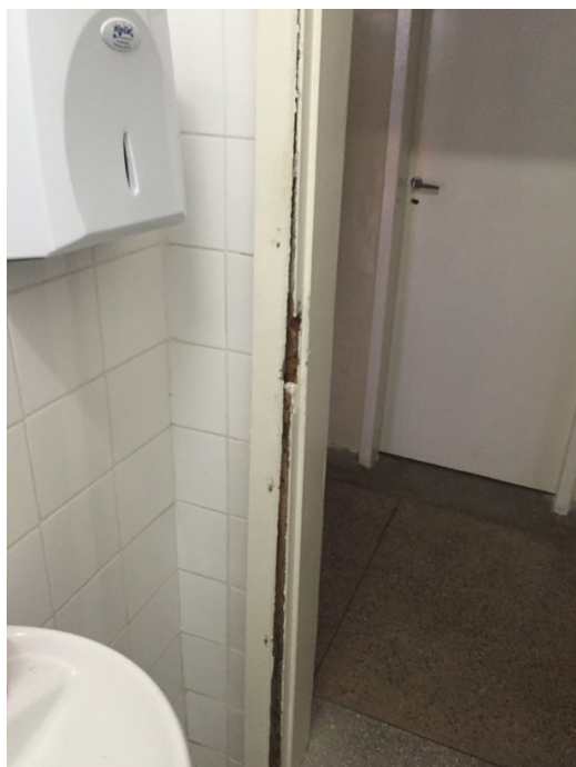
Batente do banheiro dos funcionários danificado no arrombamento