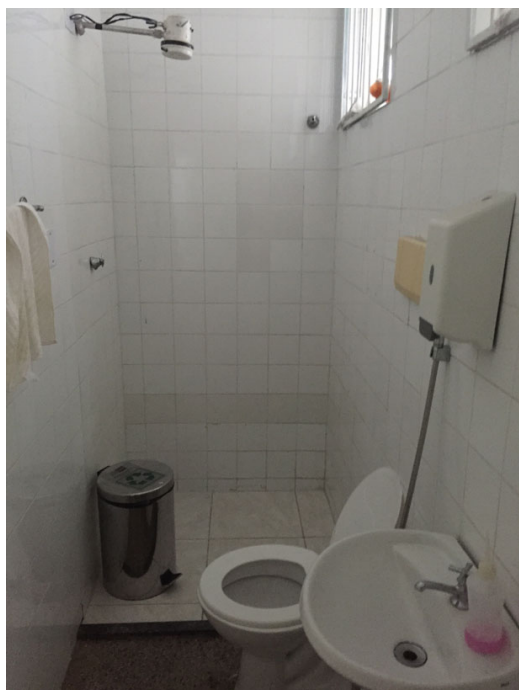
Banheiro de funcionários