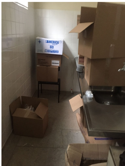
sala de esterilização