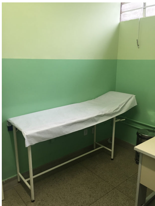
Consultório de atendimento médico