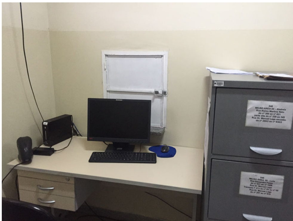
Sala Central de Marcação de Consultas