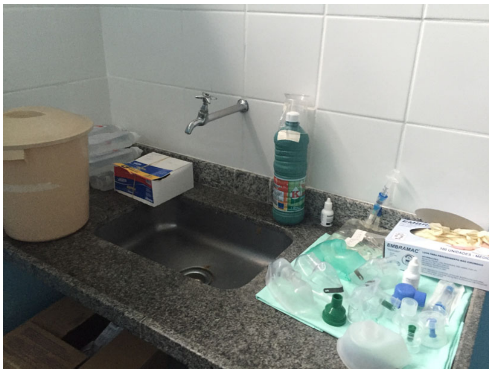
sala de nebulização