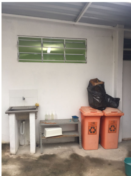
Área de descarte