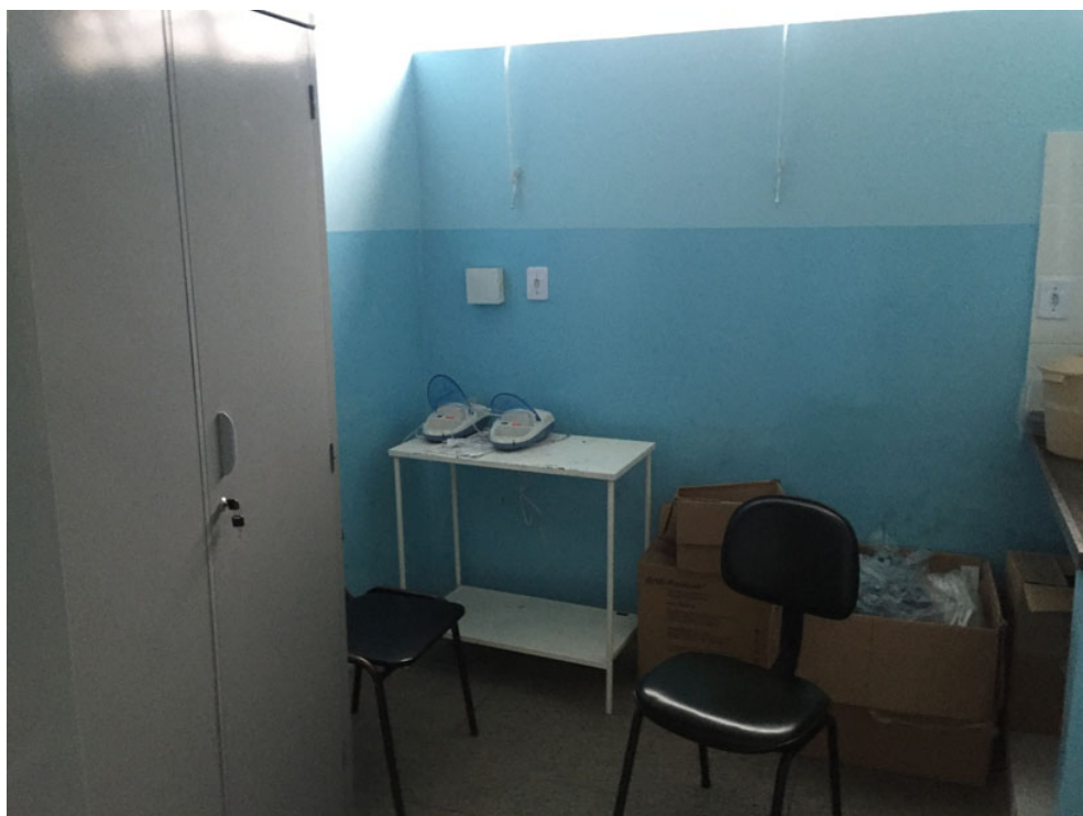
sala de nebulização